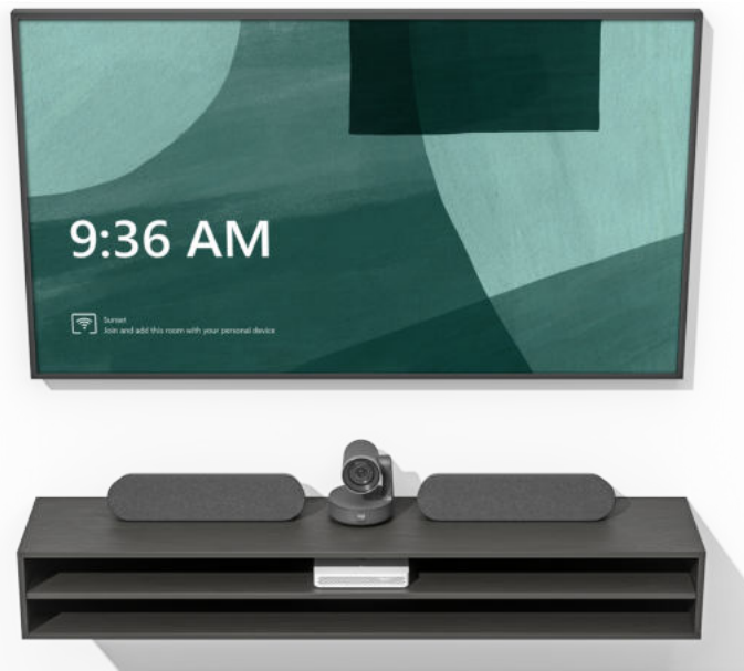
Logitech RoomMate avec Rally Plus