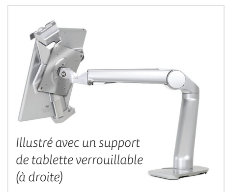
Illustré avec un support de tablette verrouillable (à droite)

Gagnez du confort, de l'ergonomie et une productivité accrue avec un bras de montage sur bureau ou au mur élégant et abordable.