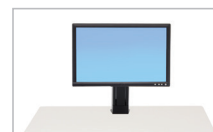
Trousse pour moniteur unique basse définition 97-905 (noir)