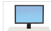
Trousse pour moniteur unique haute définition 97-906 (noir)