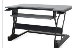
Poste de travail assis-debout de bureau WorkFit-T