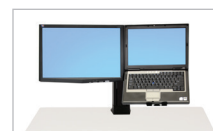
Trousse pour écran LCD et ordinateur portable 97-907 (noir)