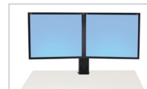
Trousse pour double moniteur 97-904 (noir)