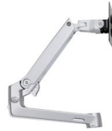
ARGENTÉ AVEC ACCENTS BLANCS #98-130-231