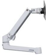
BLANC AVEC ACCENTS GRIS #98-130-216