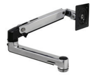
ALUMINIUM POLI AVEC ACCENTS NOIRS #97-940-026

NÉCESSAIRE POUR AJOUTER UN TROISIÈME ET QUATRIÈME BRAS À LA VERSION COLONNE HAUTE