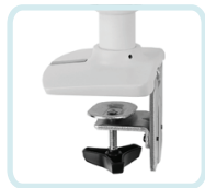
COMPRIS AVEC LE BRAS LX À SUPERPOSITION DOUBLE: LA PINCE DE BUREAU À 2 PIÈCES STANDARD SE FIXANT AU BORD DE LA SURFACE