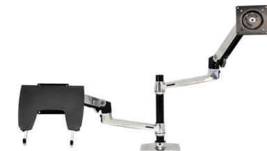
LE KIT TABLETTE POUR ORDINATEUR PORTABLE AFFICHÉ EST LIVRÉ EN STANDARD AVEC UN BRAS DOUBLE ÉCRAN EN SUPERPOSITION EN ALUMINIUM POLI #45-248-026

POUR DES BRAS DOUBLE ÉCRAN LX BLANC, LE KIT TABLETTE POUR ORDINATEUR PORTABLE PEUT ÊTRE COMMANDÉ SÉPARÈMENT #50-193-200 (EN NOIR UNIQUEMENT)