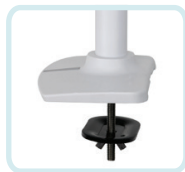
COMPRIS AVEC LE BRAS LX À SUPERPOSITION DOUBLE, COLONNE HAUTE : KIT DE FIXATION PAR PINCE TRAVERSANTE S'INSTALLANT DANS UN PASSE-CÂBLE