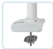
ACCESSOIRE DE PINCE EN C SOUS BUREAU BLANC 98-085 : SE FIXE PAR LE BORD DE LA SURFACE