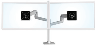
CONFIGURATION STANDARD SUPPORTANT DEUX ÉCRANS