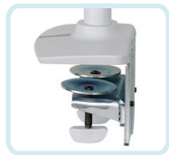
COMPRIS AVEC LE BRAS LX À SUPERPOSITION DOUBLE, COLONNE HAUTE : PINCE DE BUREAU ROBUSTE À DEUX PARTIES SE FIXANT SUR LE REBORD D'UNE SURFACE PLANE