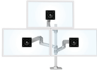
ILLUSTRÉE AVEC UN BRAS LX, UNE EXTENSION ET UN KIT DE MANCHON POUR SUPPORTER TROIS ÉCRANS