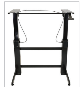
Base assis-debout WorkFit-B HD