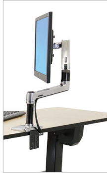
Ajoutez au besoin des supports Ergotron d'installation de LCD et de portable pour tenir compte des flux de travail individuels