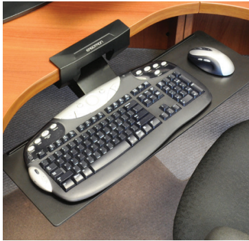
Pour un placement ergonomiquement correct du clavier, on recommande le bras de clavier Neo-Flex Underdesk d'Ergotron (97-582-009)

Plage de tailles du plan de travail 104-183 x 60-76 x 2-4,4 cm