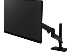
Bras LX Pro, Potence haute